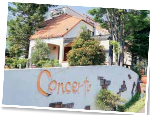
イタリアンレストラン「パスタ デ コンチェルト」