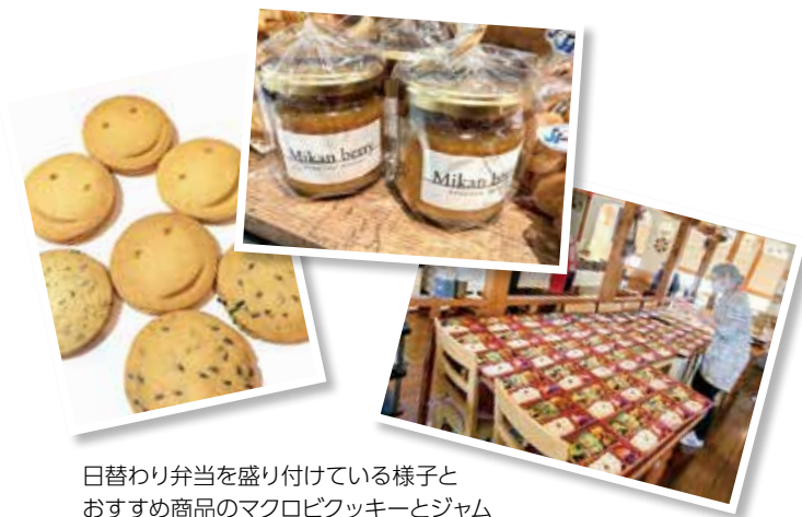
日替わり弁当を盛り付けている様子とおすすめ商品のマクロビクッキーとジャム

利用者と社員が共に作った美味しいお弁当に健康志向のクッキーやジャムを、皆さんも是非手に取ってみてください!