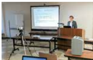
オンライン研修用動画撮影の様子